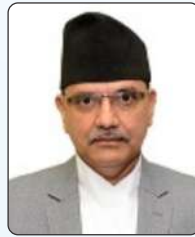
माननीय माधव बेल्हासे सदस्य लोकसेवा आयोग