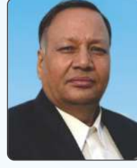
माननीय शिक्षा, विज्ञान तथा प्रविधि मन्त्री देवेन्द्र पौडेल