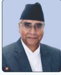
सम्माननीय प्रधानमन्त्री शेर बहादुर देउवा