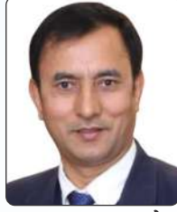
डा. पुष्प रमन वाग्ले सदस्य, राष्ट्रिय योजना आयोग